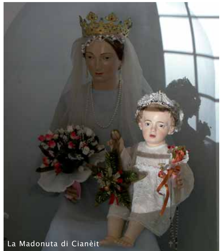
La Madonuta di Cianët