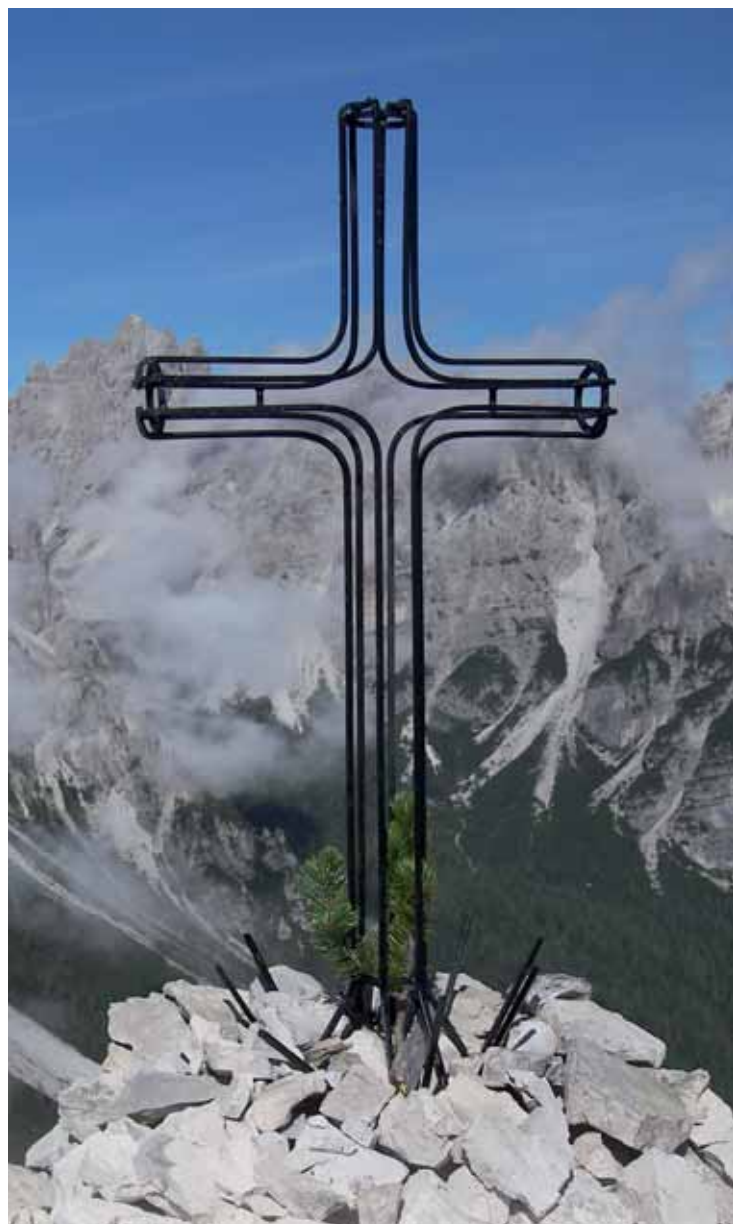
LA NUOVA CROCE DEPOSTA IL 23 AGOSTO 2009 SULLA CIMA DEL MONTE URTISIEL EST A FORNI DI SOPRA - DOLOMITI UN GRAZIE A DIO PER IL DONO DI QUESTO PARIMONIO