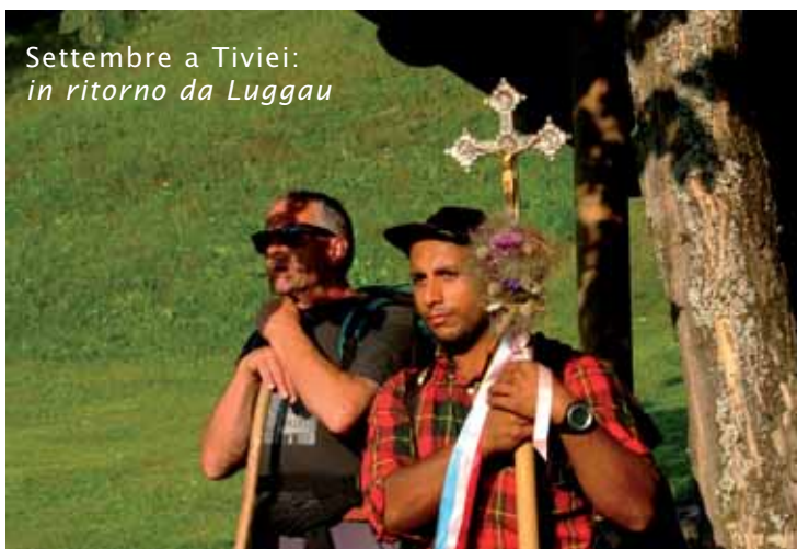
Settembre a Tivieì: in ritorno da Luggau