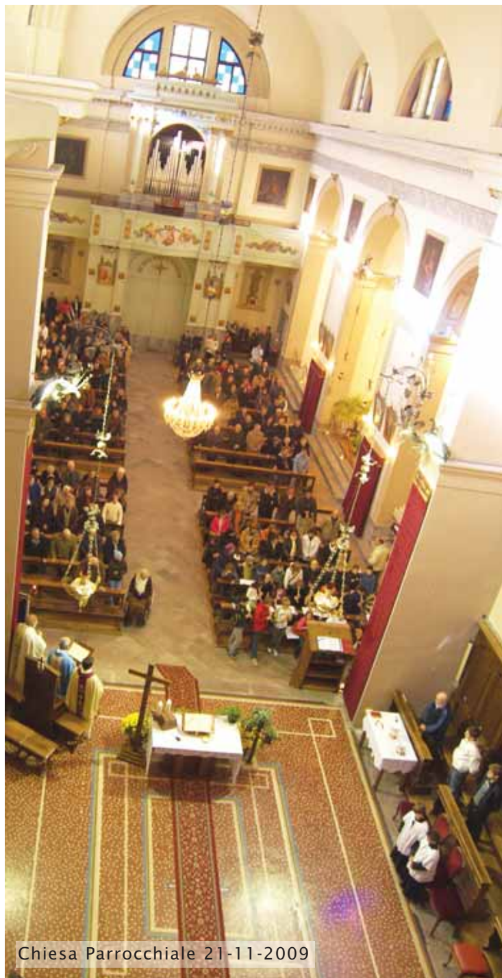
Chiesa Parrocchiale 21-11-2009