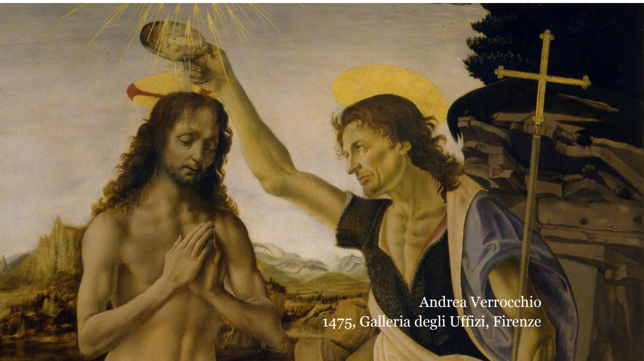
Andrea Verrocchio 1475, Galleria degli Uffizi, Firenze

Il Parroco chiuderà quindi l'incontro dando l'idea che non si tratta dell'ultima tappa di un cammino ora concluso, ma che il cammino più bello è ancora davanti. La preghiera finale, con una benedizione del piccolo e dei genitori, sarà il miglior congedo.