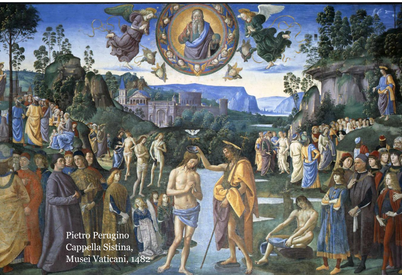
Pietro Perugino Cappella Sistina, Musei Vaticani, 1482