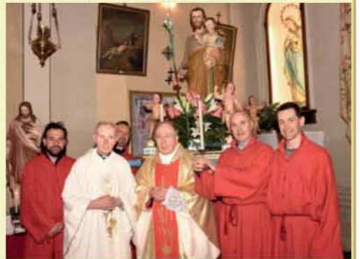
A sinistra: La processione attraverso le strade di Blessano.