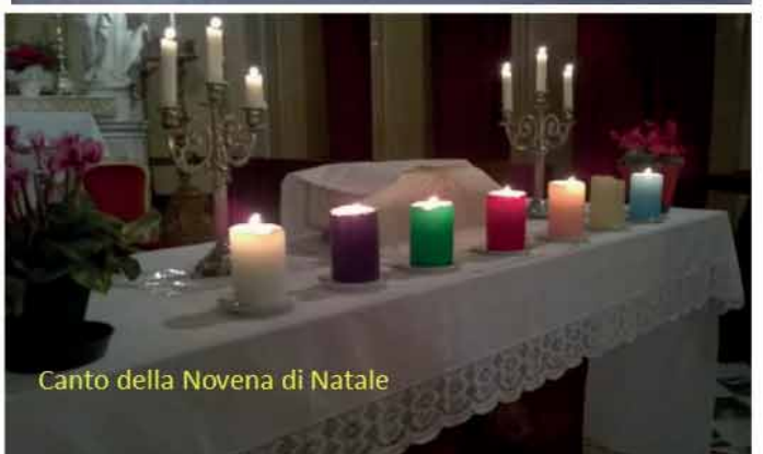
Canto della Novena di Natale