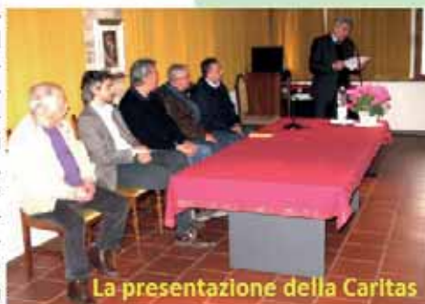
La presentazione della Caritas

difficoltà. Non solo aiuto materiale, ma anche sostegno morale e spirituale, perché ogni persona nella sua realtà- possa migliorare sé stessa e possibilmente inserirsi nella comunità e nella società. Il Centro di ascolto Caritas, aperto il martedì (17.00-19.00) e il venerdì (9.00-11.00) cerca di essere la reale risposta ai bisogni profondi delle persone. In questi termini si è espresso il Direttore della Caritas diocesana. Il Sindaco ha espressamente condiviso